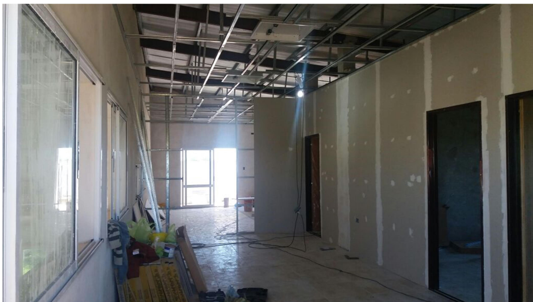
Aquí se observa la construcción de las oficinas y sanitarios ubicadas en la planta alta.