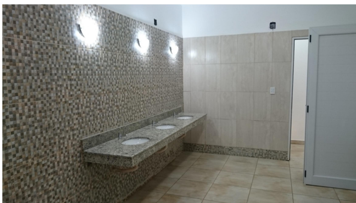
Dos vistas de los vestuarios construidos en planta baja y con acceso desde el salón de fiestas.